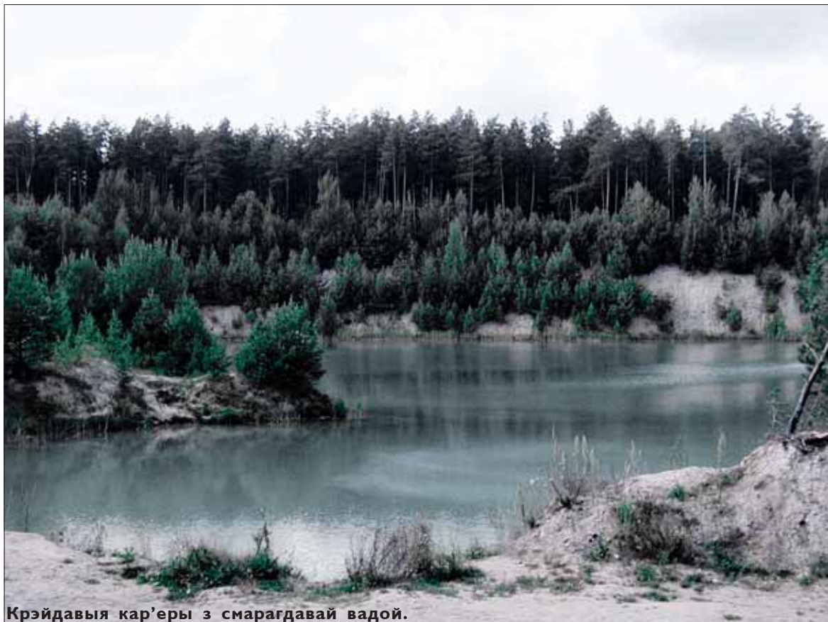
Крэйдавыя кар'еры з смарагдавай вадай.

між асфальтавых дарогаў, ля вёскі Ператок, можна сустрэць людзей, якія кленчаць ля святога каменю. Яны нясуць сюды вянкi з палявых кветак і ваду. Гэты камень мае назву Слядок Божы, або Божы камень. Людзі ідуць да каменя ў першую нядзелю пасля маладзіка. Яму кладуць ахвяры: малако, мёд, яблыкі і нават запіхваюць у яго адтуліны, нібы ў рот, цукеркі. Гэты шэры умшэлы валун, увесь працягты адтулі-