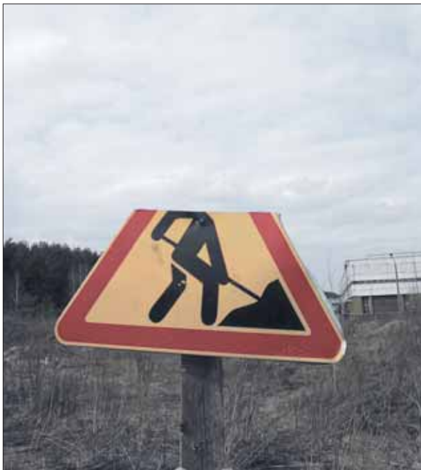
Новы знак: «Асцярожна! Нізкія верталёты». Заўважыў ЛК