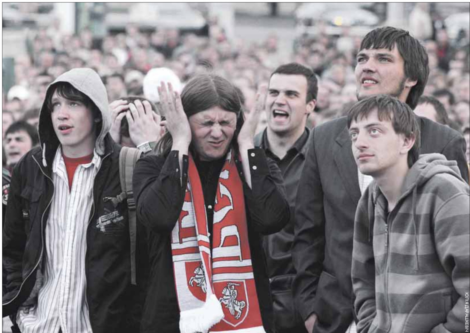
Маглі б і лепей. Заўзятары ў часе матчу Беларусь-Расія перад экранам каля Палацу спорту.

Беларусь гуляла на роўных з Расіяй у Швейцарыі і прыме чэмпіянат свету 2014 году.