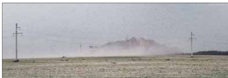
«Горы» на даяглядзе.

між асфальтавых дарогаў, ля вёскі Ператок, можна сустрэць людзей, якія кленчаць ля святога каменю. Яны нясуць сюды вянкi з палявых кветак і ваду. Гэты камень мае назву Слядок Божы, або Божы камень. Людзі ідуць да каменя ў першую нядзелю пасля маладзіка. Яму кладуць ахвяры: малако, мёд, яблыкі і нават запіхваюць у яго адтуліны, нібы ў рот, цукеркі. Гэты шэры умшэлы валун, увесь працягты адтулі-