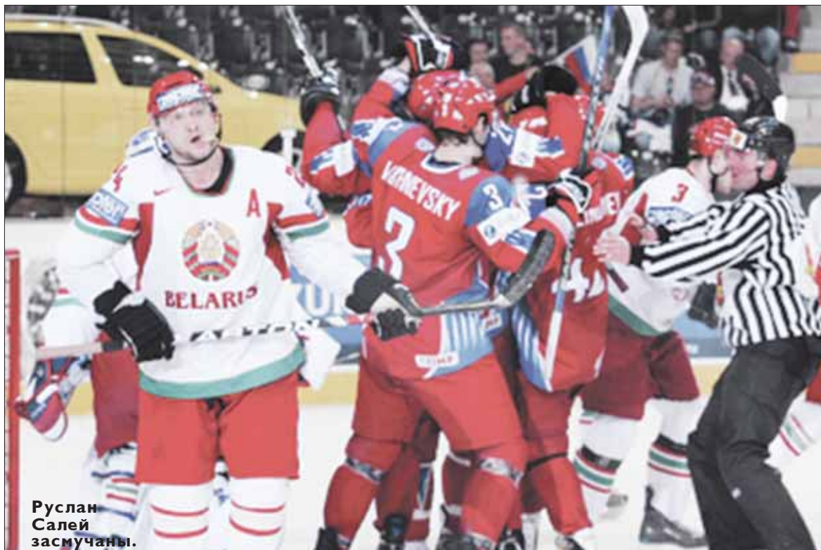
Руслан Салей засмучаны.