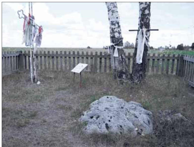
Слядок Божы — культавы камень, якому дагэтуль пакланяюцца.

намі, дзіркамі, паглыбленнямі, нібы павялічаны ў маштабе кавалак вулканічнай пемзы. Хоць гэта — граніт. Многія дзіркі скразныя. Людзі ліюць у іх ваду. Вада, якая пройдзе ў адну адтуліну і выльецца з іншай, лічыцца гаючай. Ёю лечаць розныя хваробы. Калі не замінаць, можна стаць сведкам унікальнага архаічнага відовішча. Старэйшыя людзі з наваколля цалуюць камень і гладзяць, нібы жывога. Шчыра перакрываюць, каму і ад чаго дапамог