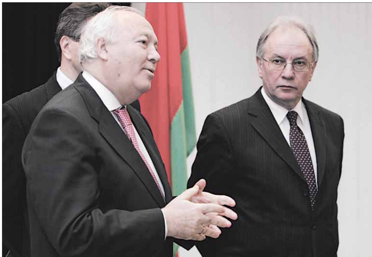
Далікатная задача данесці да Аляксандра Лукашэнкі, што ў Прагу яму лепш не ехаць, выпала міністру замежных справаў Іспаніі Мігелю Марацінасу.