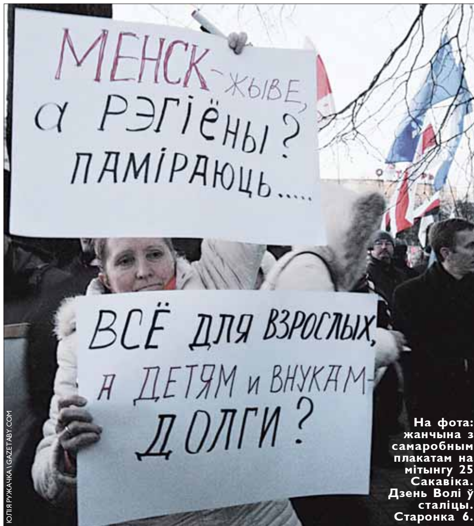
На фота: жанчына з самаробным плакатам на мітынг 25 Сакавіка. Дзень Волі ў сталіцы. Старонка 6.