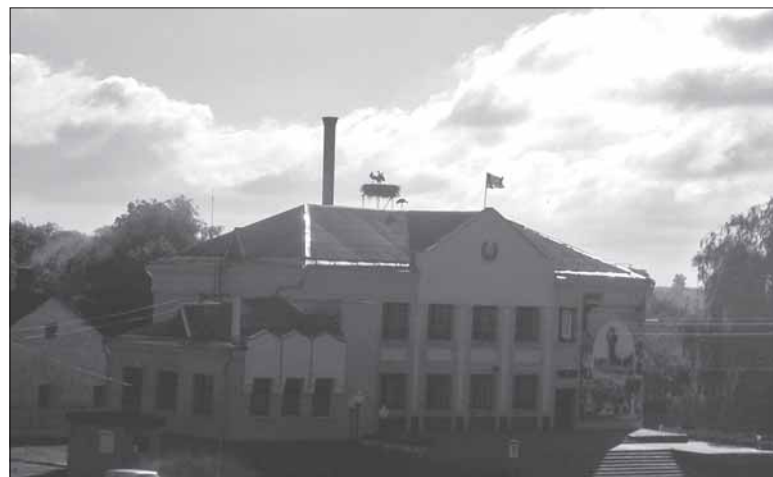
Сівы Тураў. Буслынка на выканкаме.

Разам параю меншых азёраў, прытокамі, вытокамі, Даманавіцкім і Рэпішчанскім каналамі, тут — цэлы мікракосмас. Працуюць рыбгасы, здабываюць сапрапелі, абслугоўваюць каналы і шлюзы. На высце, між каналаў, як Венецыя, прымасціліся вёскі Баравая, мяс-