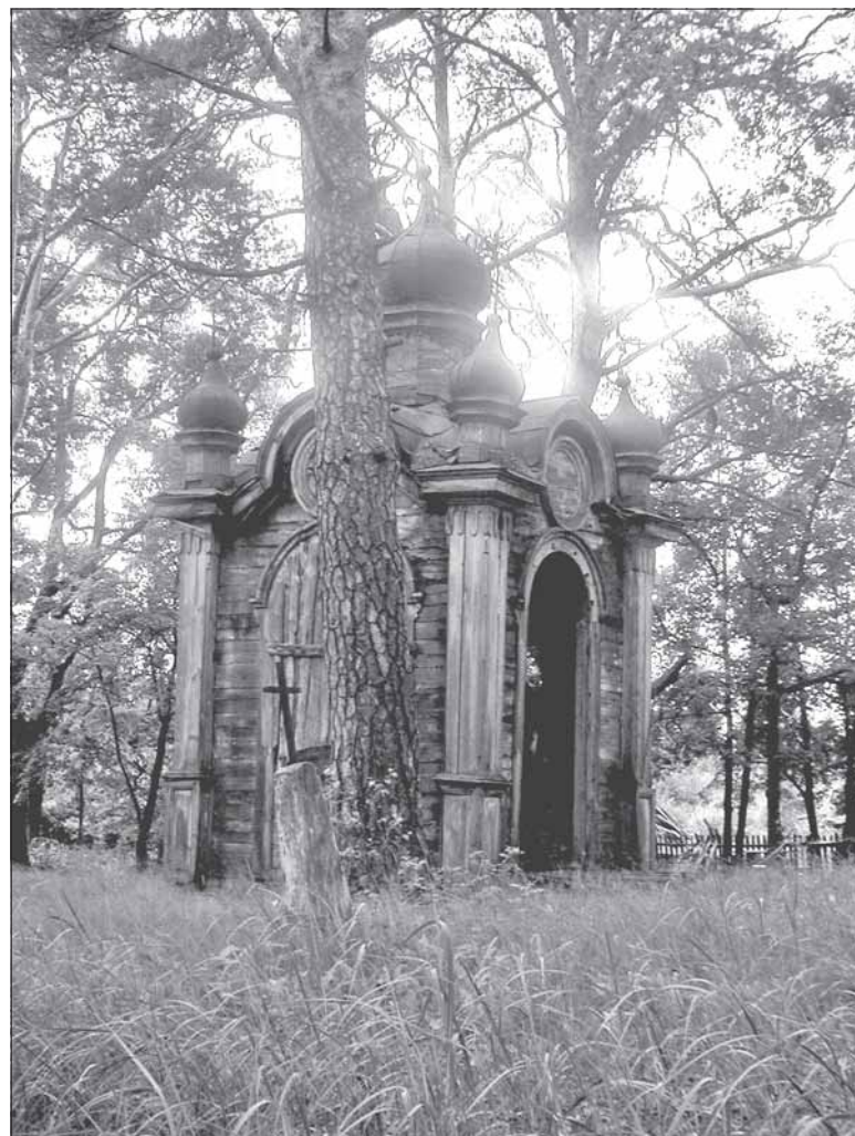
Унікальная драўляная капліца ў Леніне, пастаўленая ў гонар адмены прыгону.