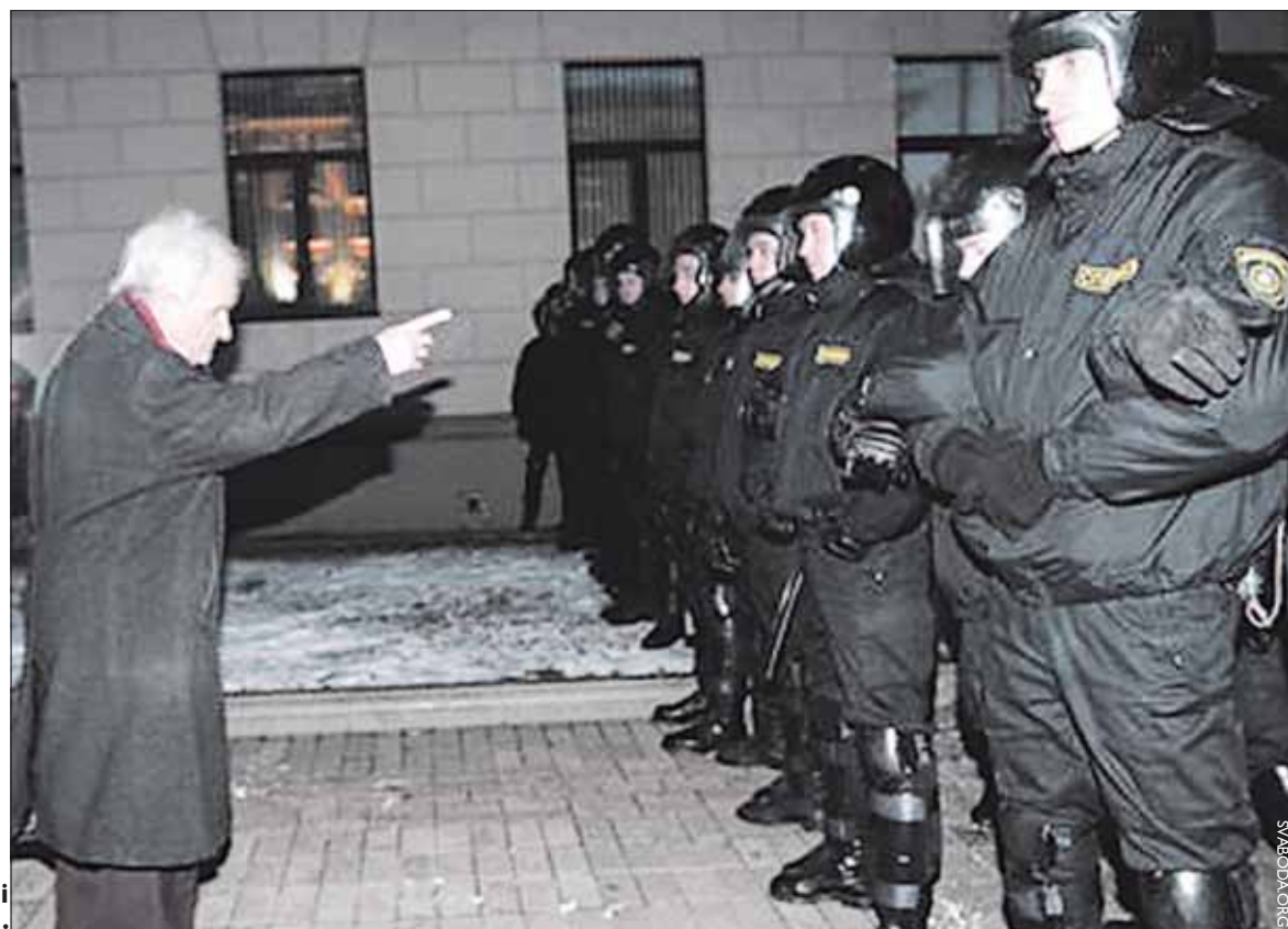
Вывучка і дысцыпліна.