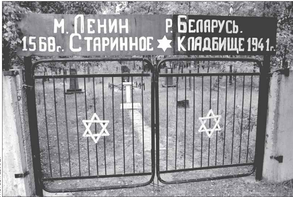
Габрэйскім могілкам у Леніне — паўтысячы гадоў. Такіх драўляных помнікаў няма болей нідзе.

А за Азяранамі, за могілкамі і крыжам, пачынаецца славуты стары Прыпяцкі запаведнік. Пры Лукашэнку ён стаў нацпаркам. У старажытным лесе завялося дрэвапрацоўчае прадпрыемства, што выпускае паркет, дошку, вагонку, выкарыстоўваючы як сыравіну Прыпяцкія дубровы. Наробілі забавак для турыстаў-палаўнічых. Але прырода і гэтае нашэсце пакуль трывае. Бо ўвядначасе змяншаецца гаспадарчая дзейнасць на вёсках. Людзей становіцца ўсё меней. Тут, у палескай глушы, ужо не рэдкія чорныя буслы ды белыя чаплі. Цяпер тут ходзіць ужо сотня зуброў, багата ласёў, аленьяў ды розных драпеж-