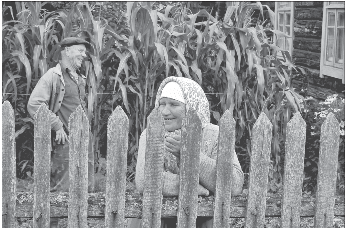
Добрых падарожжаў у невядомую Беларусь зычыць «НН»!