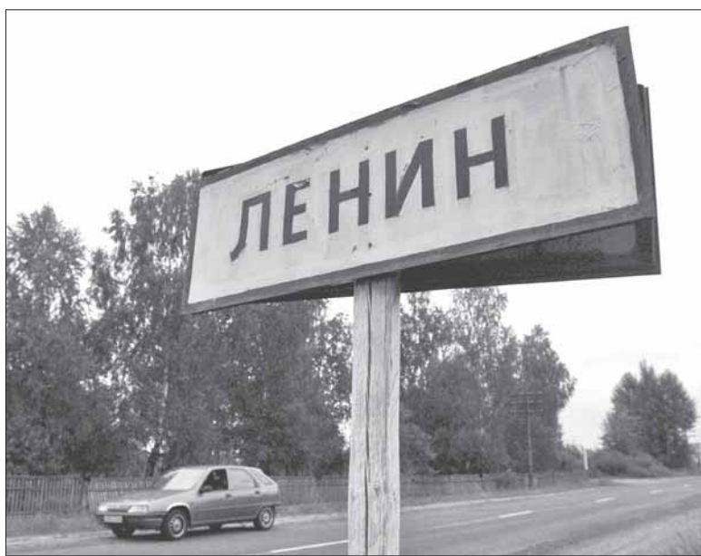
Гэта адзіны Ленін не ў гонар Леніна