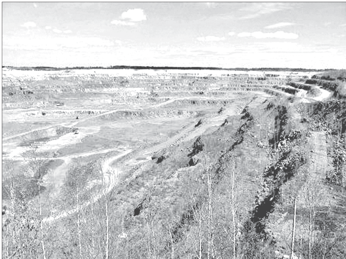
З галавакружнае вышыні гранітных скалаў у Глушкавічах можна сузіраць Украіну.

Жыве тут і свой дзівак — Уладзімір Баярын, які ўсё жыццё прысвяціў пошуку доказаў таго, што Уладзімір Ілліч Ульянаў узяў сабе псеўданім менавіта ад назвы мястэчка. Маўляў, мясцовыя габрэі перадалі шчодрое ахвяраванне на сацыял-дэмакратычную справу і ў гонар таго, маўляў, Ульянаў узяў сабе псеў-